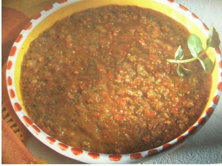
Resim 2.2: Domatesli biberli gazpaço