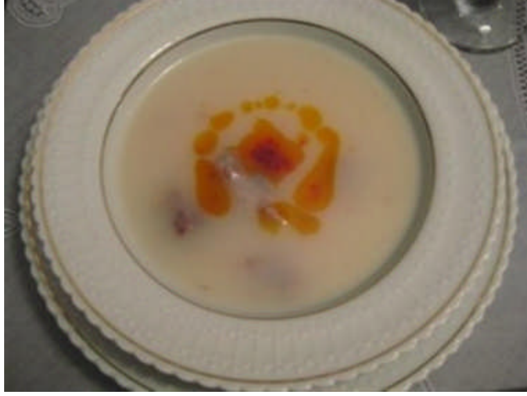
Resim 1.11:İşkembe çorbası