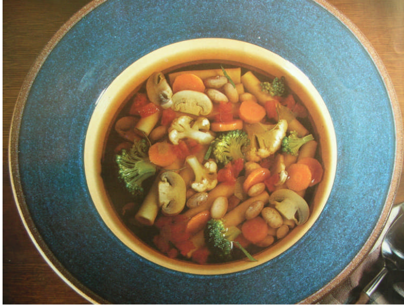
Resim 1.1: Minestrone (İtalyan çorbası)

Pesto: Tereyağı, sarımsak, mercan köşk otu ve fesleğen hepsi beraber iyice kıyılır. Yumuşak krem haline getirilir ve çorba ocaktan inince eklenir karıştırılır, hemen servis edilir.