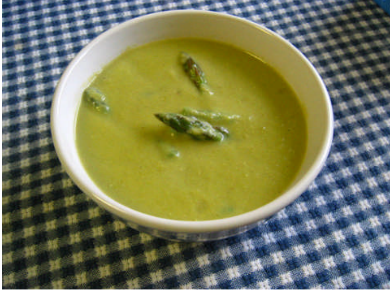
Resim 1.10:Kremalı kuşkonmaz çorbası

Üzerinin kabuk bağlaması için fındık büyüklüğünde tereyağı bırakın ve benmaride bekletin