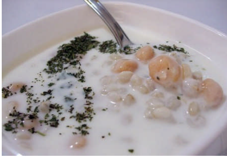
Resim 2.9: Soğuk ayran çorbası