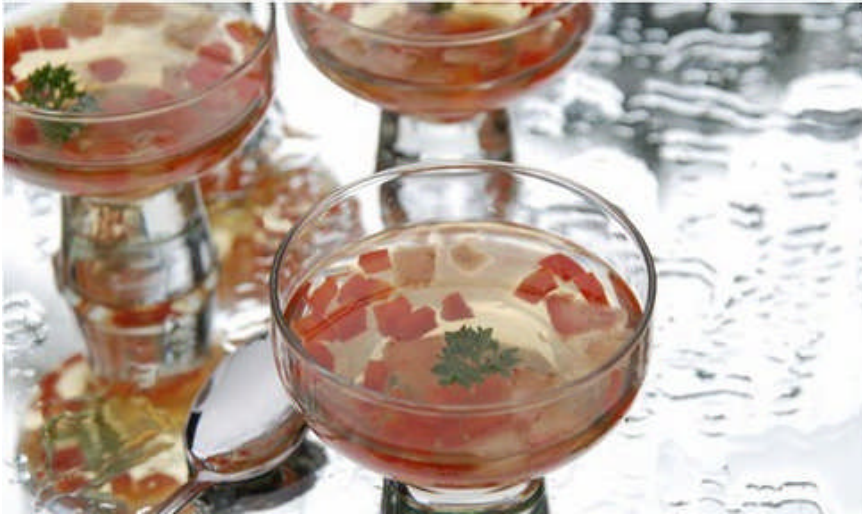
Resim 2.1: Domatesli berrak soğuk konsome (Gold Consommé)

Klasik consommé bol kereviz ve domates ilavesi ile hazırlanır. Soğutulmuş katılaşmış consommé'nin üzerine soyulmuş, çekirdekleri çıkarılmış 3 mm küpler halinde doğranmış domatesler konur ve servis edilir.