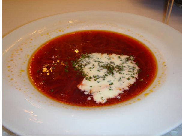
Resim 1.5: Polonya usulü borç çorbası

Not: Pancar suyunu, soyulup rendelenmiş pancarın üzerini aşacak kadar soğuk suda biraz bekletip tülbentten süzerek hazırlayabilirsiniz. Ayrıca, bu çorbanın malzemeleri isteđe bađlı olarak deđişik şekillerde de doğranabilir.