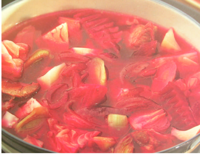
Resim 1.4: Potage Borscht (Rus sebze çorbası)