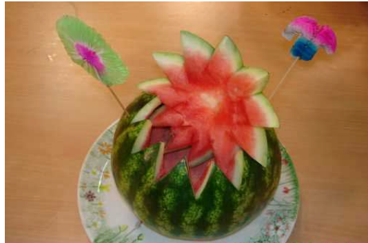
Resim2.7: Soğuk karpuz çorbası