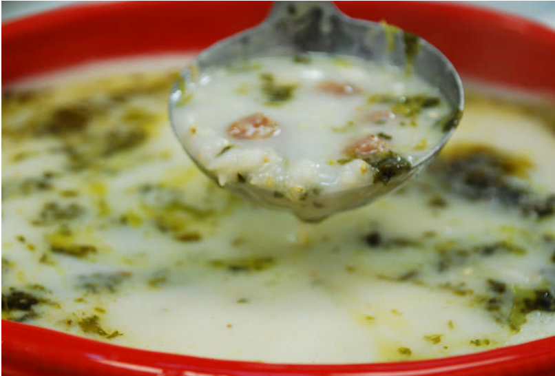
Resim 2.10: Aşotlu Yoğurt Çorbası

Sürekli karıştırarak kaynamaya yakın soğanlı, naneli, yağlı karışımı da ekleyin. Karıştırmaya devam edin. Tuz, karabiberi ekleyin. Fokurdamaya başladıktan 2-3 dk sonra altını kapatın.