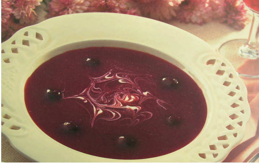
Resim 2.4: Soğuk vişne çorbası