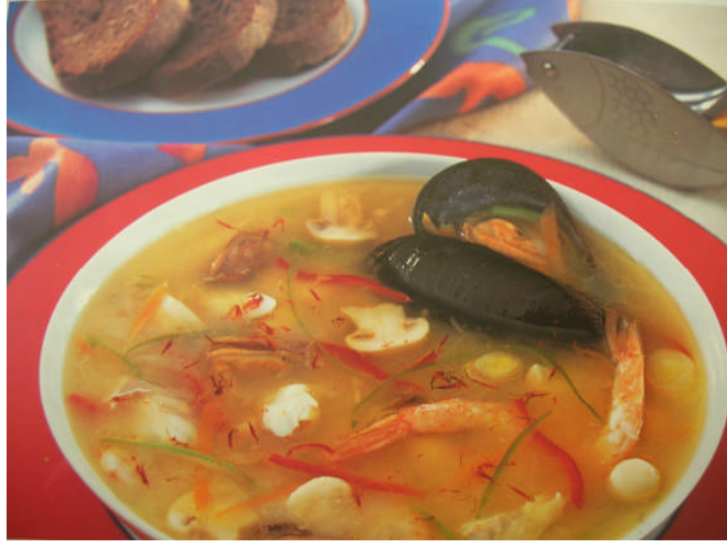
Resim 1.9: Bouille boisse (buyabez)