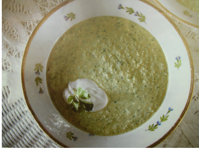
Resim2.6: Dereotlu soğuk avokado çorbası