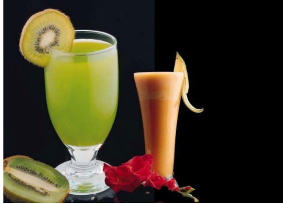
Resim2.8.a,b: Soğuk kavun ve kivi orbasi