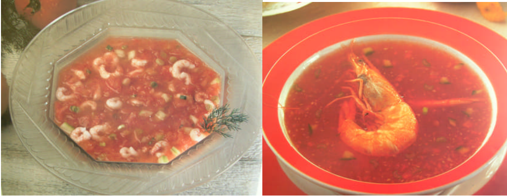
Resim 2.5: Karidesli soğuk domates çorbası

Tuz karabiberini de ekledikten sonra tencerenin kapağını kapatıp, buzdolabına kaldırın ve en az 1 saat soğutun. Bir saat sonunda çorbanız servise hazır hale gelecektir.