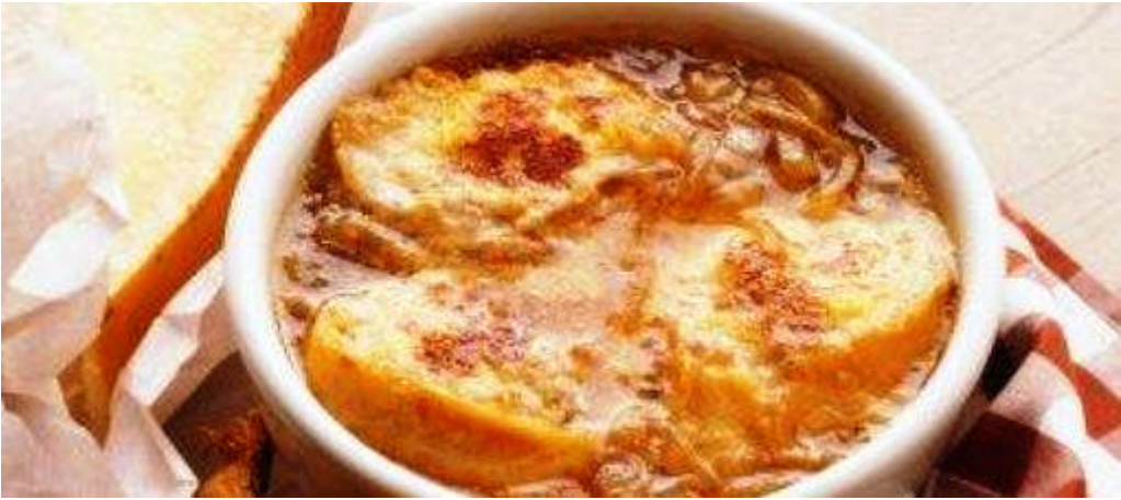
Resim1. 8: Soğan çorbası

Güvecin üstüne kapak kapatmadan salamandraya sürüp üstleri altın sarısı renk alıncaya kadar gratine ederek servis yapın.