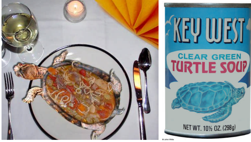
Resim 1.7:Turtle soup (kaplumbağa çorbası)

Örnek Tarihi münüler: Paris'teki Osmanlı Sefareti'nde Bir Akşam Yemeği (içinde kaplumbağa çorbası olan bir mönü örneği)