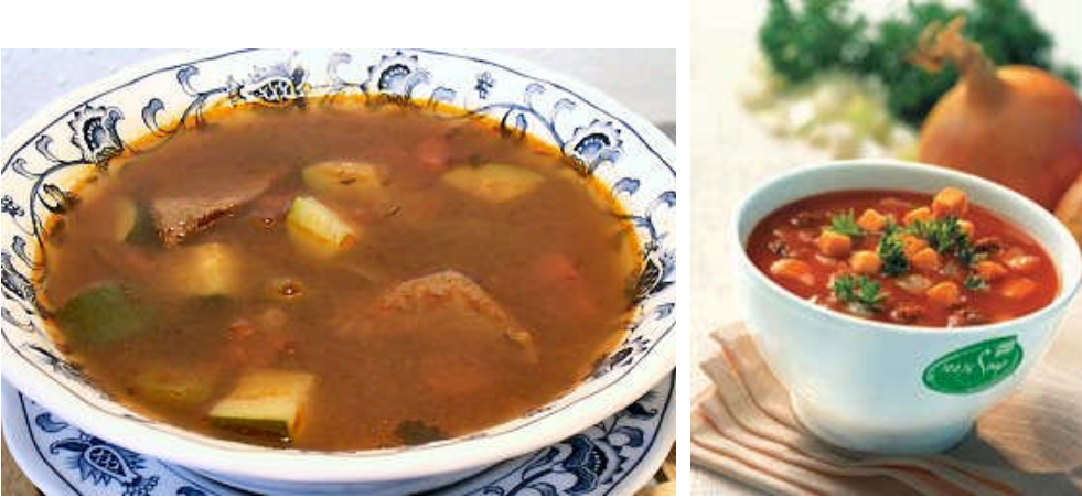
Resim 1.3: Goulash soup

Not: Goulash garnish genellikle çorbaya eklenerek servis yapılır.