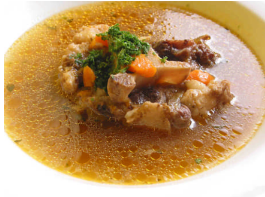
Resim 1.6: Öküz kuyruđu çorbası (oxtail soup)